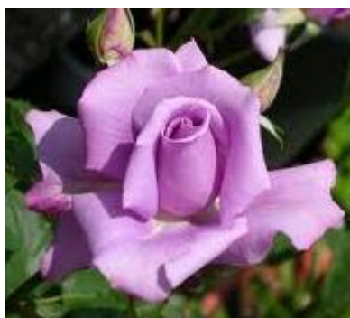
Charles De Gaulle