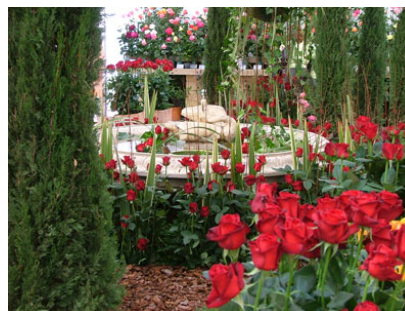
Palacio Falguera – Exposición Nacional de Rosas