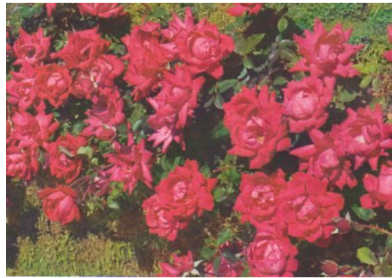
Double Knock Out