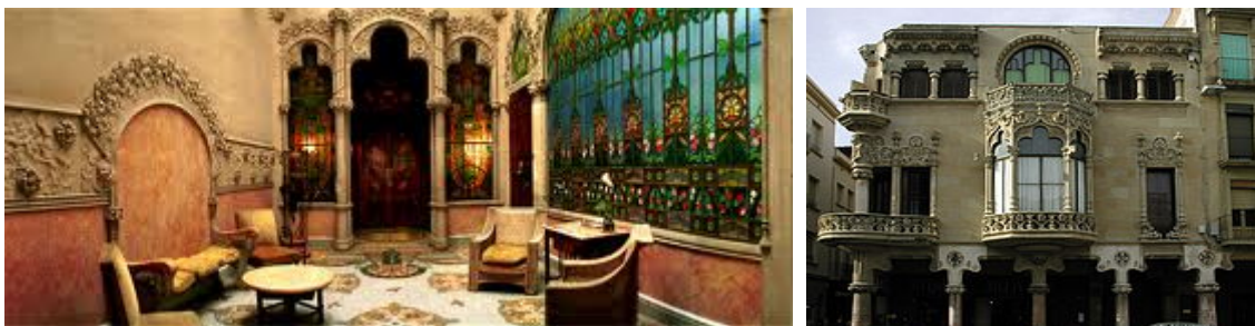
Casa Navàs en Reus